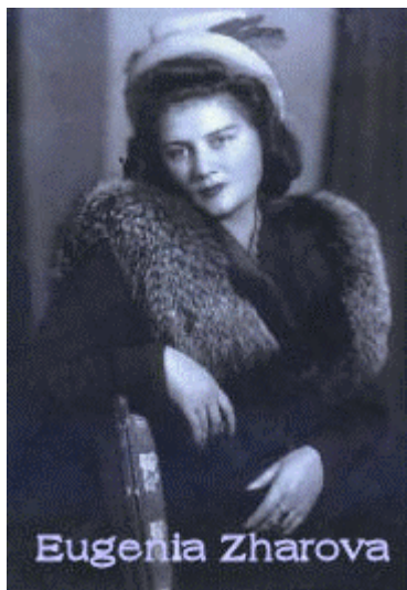
Creadora de la raza Russian Toy Terrier.

Perros muy inteligentes, ágiles, muy vivos y resistentes, sin miedos que dedicará toda su vida a su propietario. Fáciles de entrenar. Un verdadero perro de compañía.